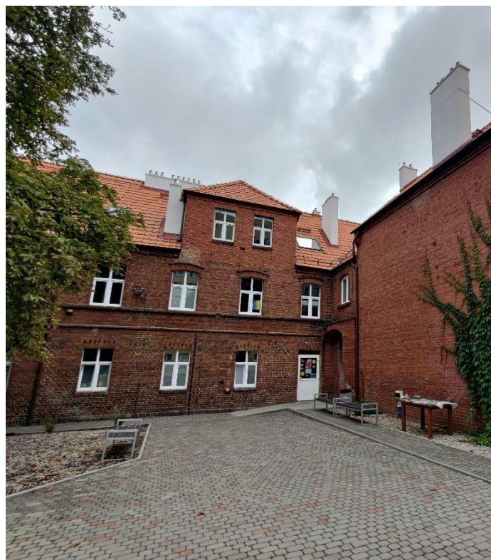
Wejście od strony podwórza.