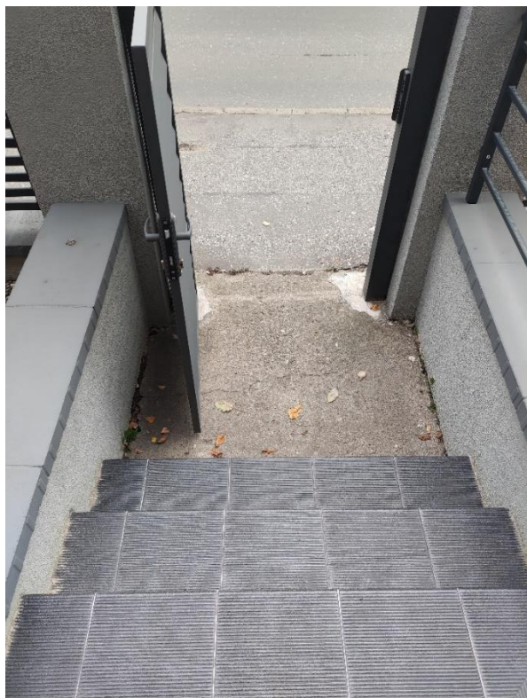
Wejście do budynku od strony ul. Karpackiej.